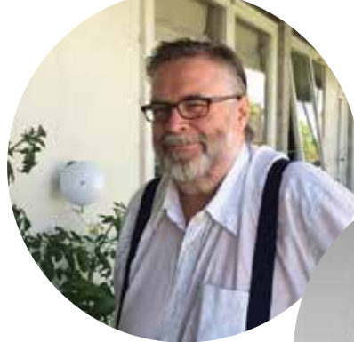
Thomaas Apath Anglophil